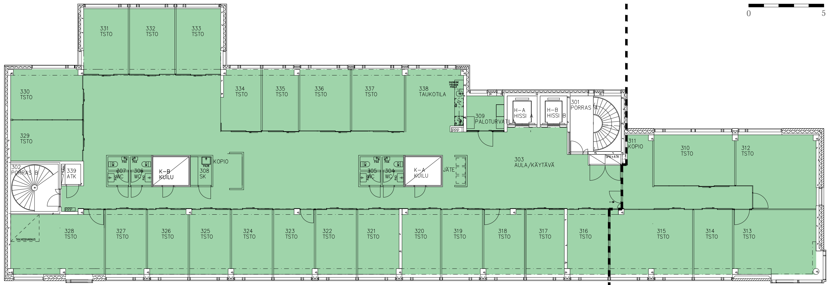
TOIMISTOTILAT 1 514,0 m 2